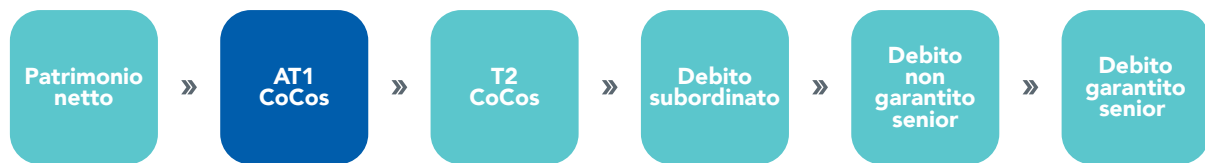
FIGURA 1: STRUTTURA DEL CAPITALE DELLE BRANCHE

A scopo esclusivamente illustrativo.