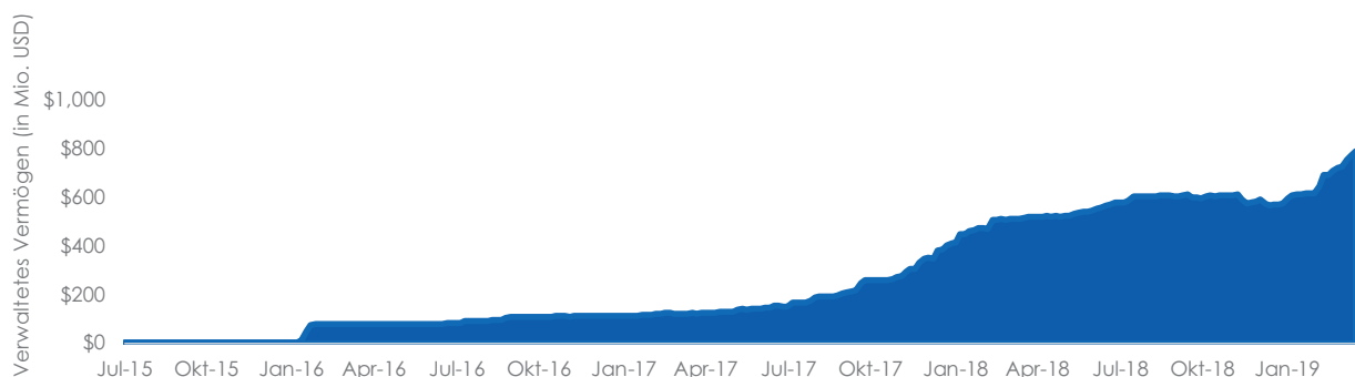
ABBILDUNG 1: ELTWEIT VERWALTETE VERMÖGEN IN ENHANCED-YIELD-ANLEIHEN-ETFs VON WISDOMTREE

Stand: 26. März 2019. Die Wertentwicklung in der Vergangenheit ist kein Maßstab für zukünftige Ergebnisse, und Anlagen können im Wert fallen. Sie können nicht direkt in einen Index investieren.