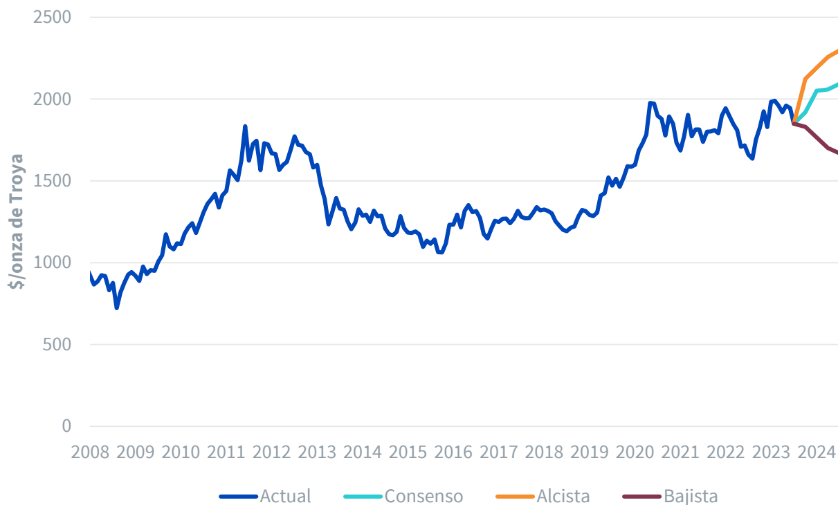
Figura 5: Previsión de los precios del oro

Las previsiones no son un indicador de la rentabilidad a futuro y las inversiones están sujetas a riesgos e incertidumbres.