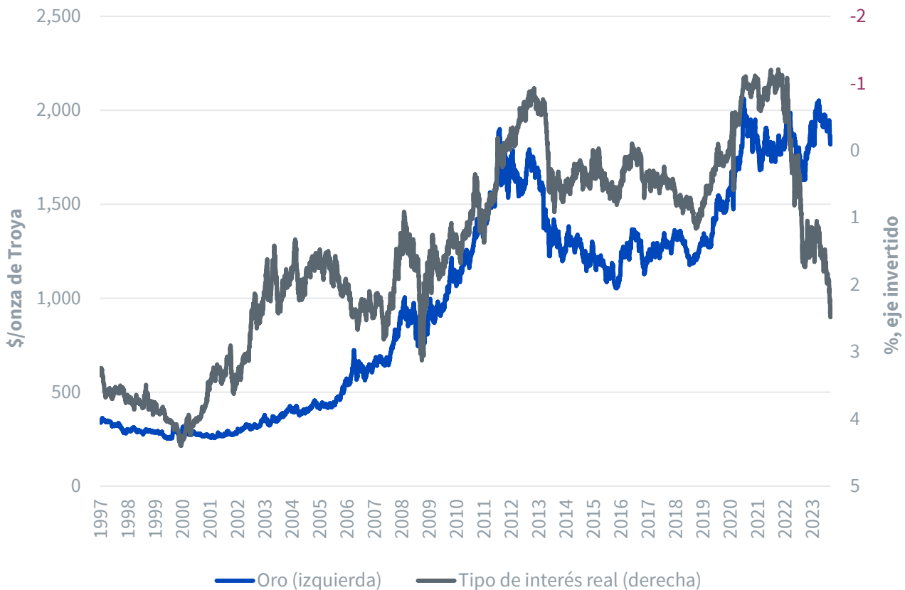
Figura 2: Oro frente a tipos reales (rendimiento de los valores del Tesoro protegidos contra la inflación)

Fuente: Bloomberg, WisdomTree. 30/01/1997 - 24/10/2023. La rentabilidad histórica no es indicativa de la rentabilidad a futuro y cualquier inversión puede perder valor.