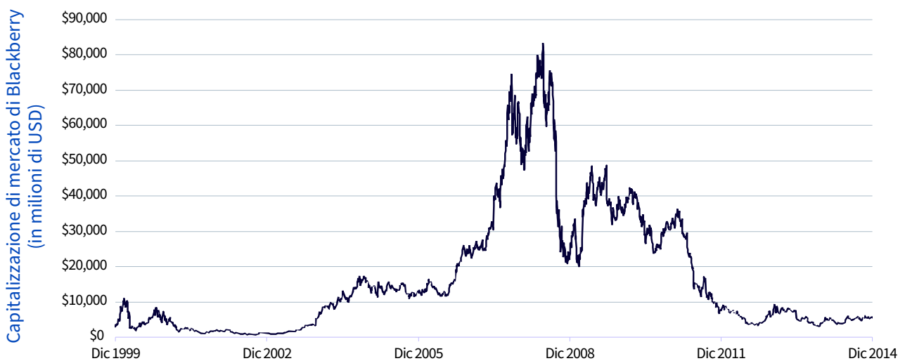
Figura 5: La capitalizzazione di mercato di Research in Motion costituisce un esempio della perdita di potenziale futuro

La performance storica non è indicativa di quella futura e qualsiasi investimento può diminuire di valore.