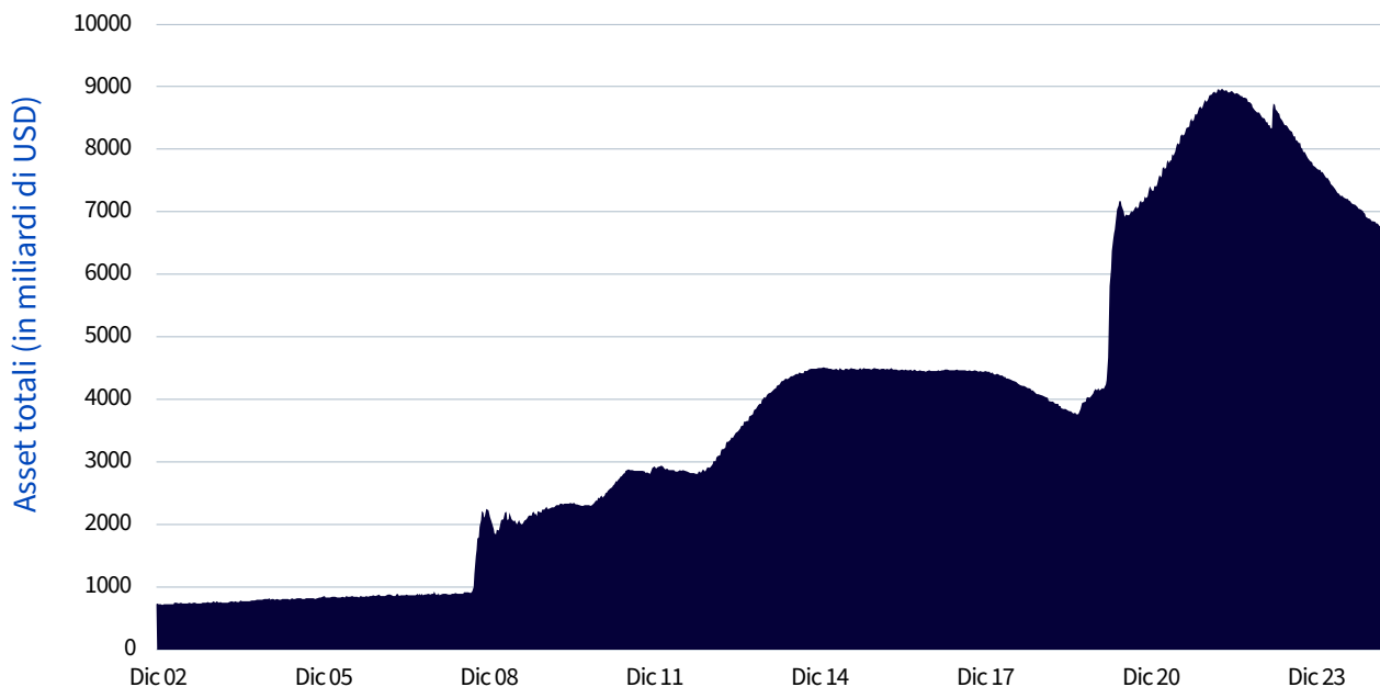
Figura 3: Evoluzione del bilancio della Federal Reserve statunitense nel tempo