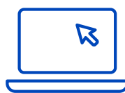
Fornitori di annealing quantistico e simulazione