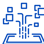
Fornitori di tecnologie di calcolo avanzato