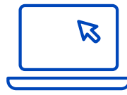
Alineación cuántica y proveedores de simulación