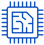
Chips cuánticos y proveedores de tecnología qubit

Reconociendo este punto de inflexión en el ámbito de la informática cuántica, WisdomTree proporciona a los inversores una exposición temprana a las empresas que impulsan el desarrollo y la adopción de esta tecnología transformadora en todo el ecosistema de la informática cuántica: