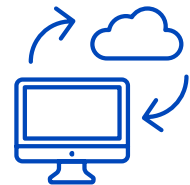
Proveedores de Quantum-as-a-Service (cuántico como servicio)