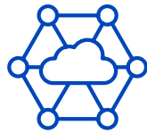
Anbieter von Quantensoftware und -algorithmen