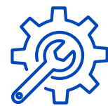
Anbieter von Tools und Infrastruktur, Halbleitern, Materialien und Komponenten für Unternehmen, die an der Entwicklung von Quantencomputing-Technologien beteiligt sind