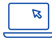
Anbieter von Quantenläufern und -simulation